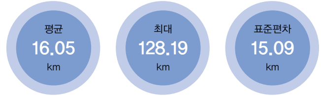
[격자] 고속도로IC 접근성(2019)