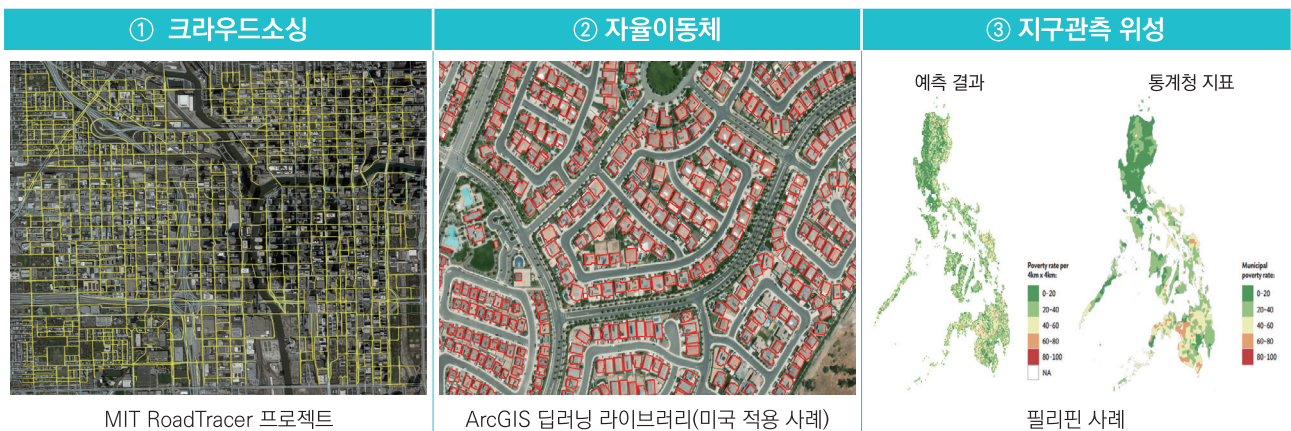
〈그림 3〉 공간정보에 특화된 AI 기술 개발 및 활용 사례