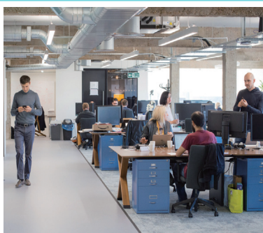
〈그림 5〉 공간정보 관련 혁신 허브 대표사례, 영국 지오베이션(Geovation)