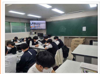
국토 발전 전시관 사이버 투어 활동