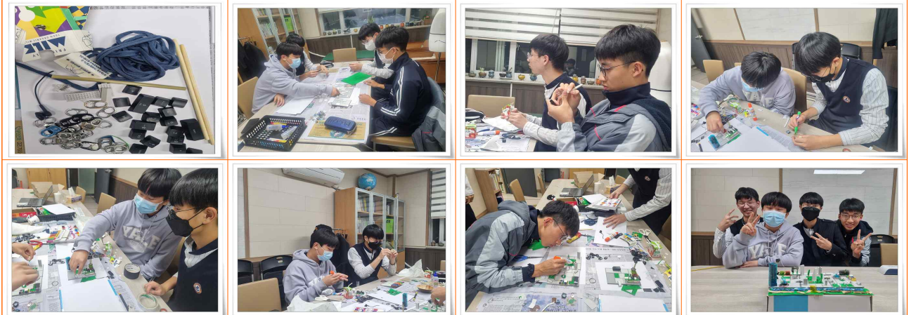
그린 시티 수원 설계하기 학생 활동 사진