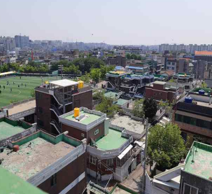
재개발 당시 학교 주변 사진