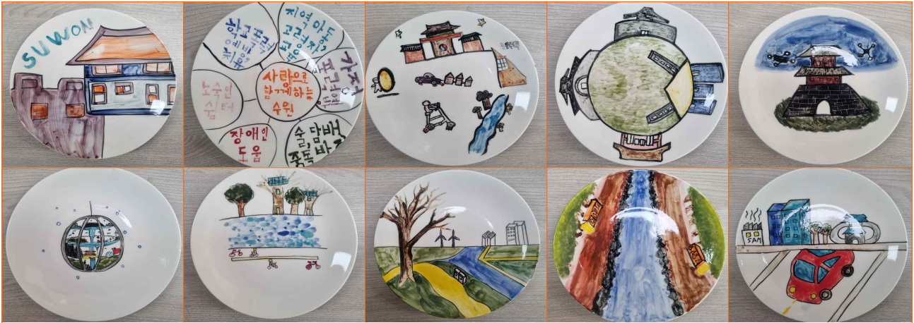
미래 도시 수원 설계 도자기 작품