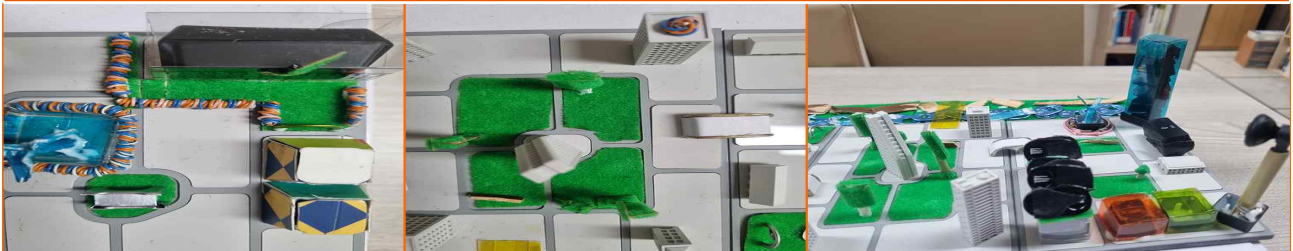
폐전선, 플라스틱 분수 키보드 버튼, 우유팩 건물