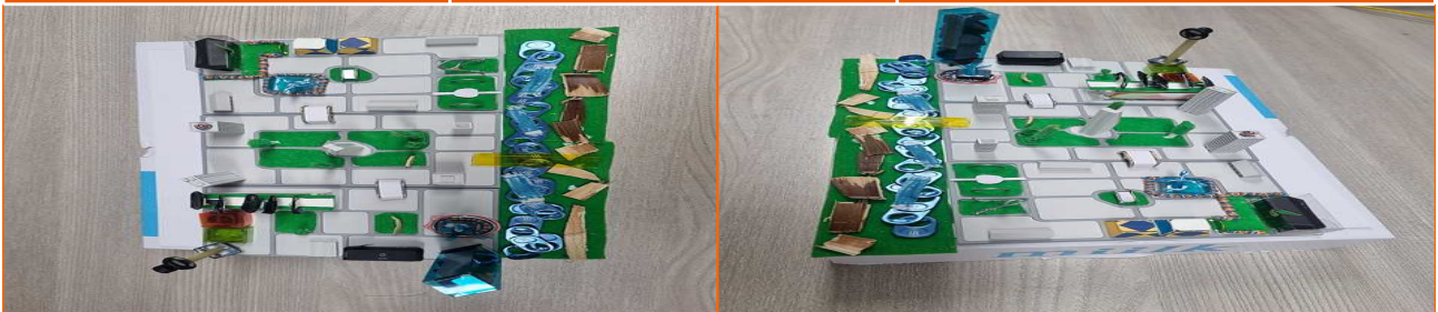
그린시티 수원 설계하기 작품