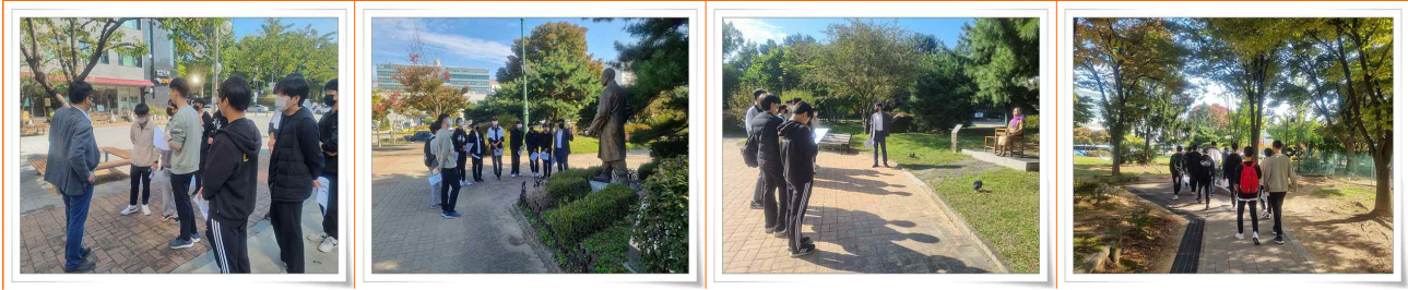
올림픽 공원 학생 활동 사진