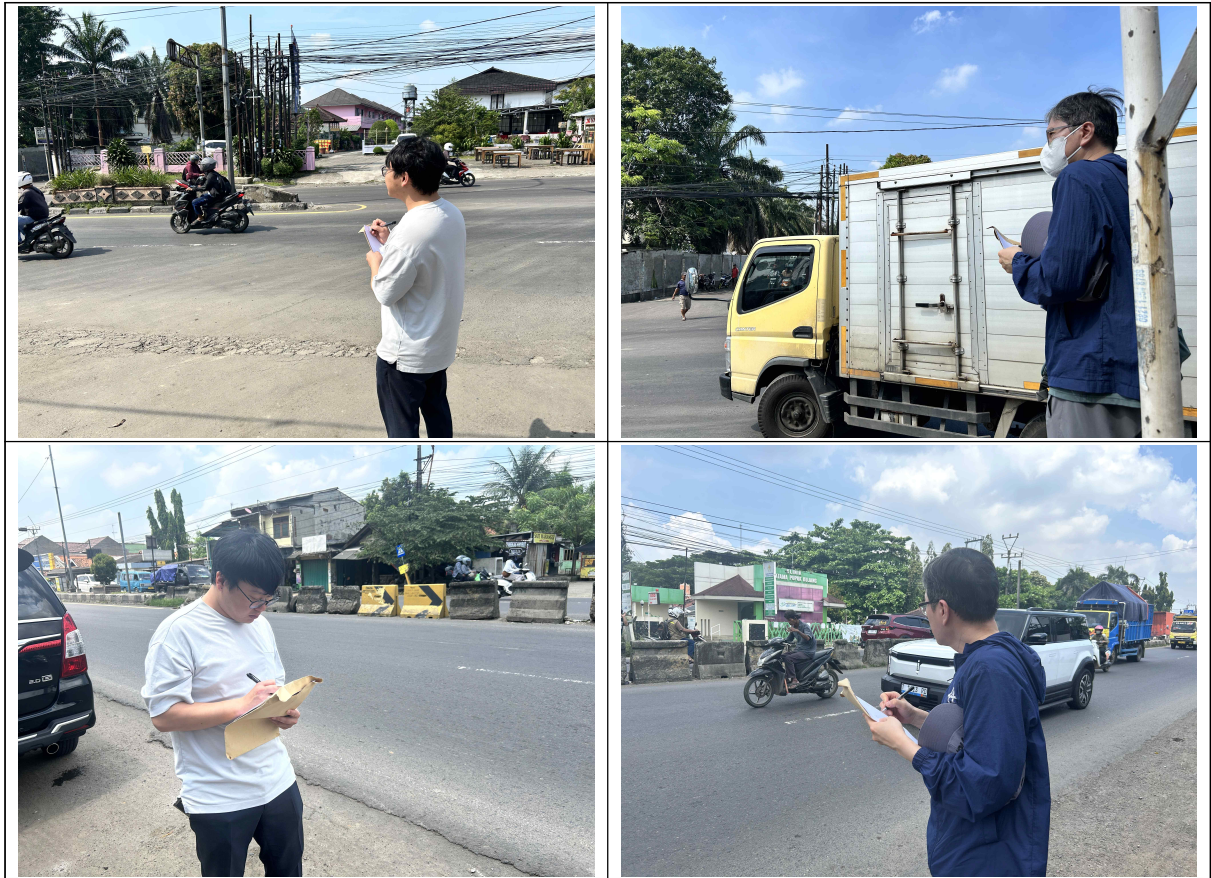
<그림> 시범사업 구간의 교통량 및 속도 조사