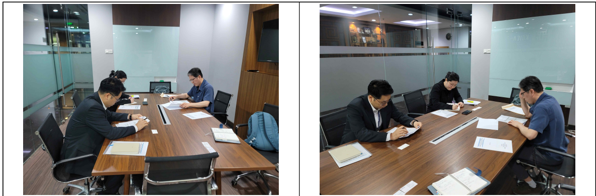
<그림> 전문가 파견 계획보고