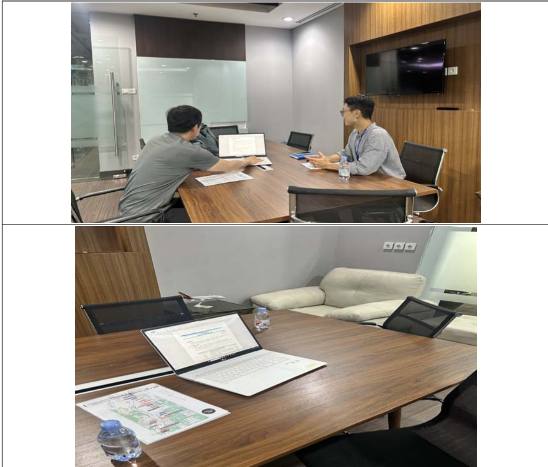
<그림> 코이카 파견 결과 보고