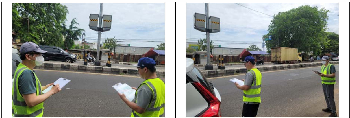
<그림> 교통량 조사 방법