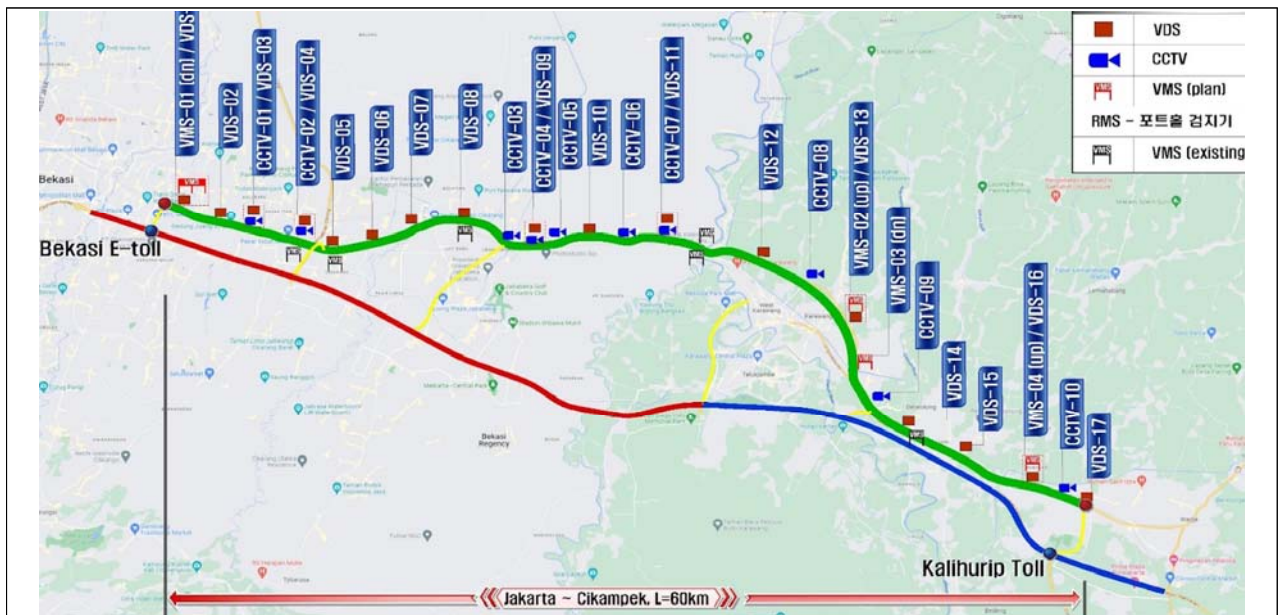
<그림> 시설물 설치 위치도