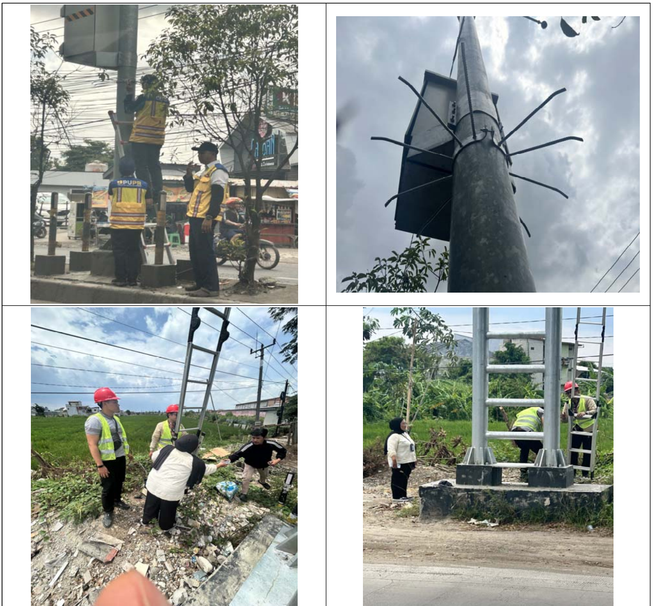
<그림> 현지 업체 보완 공사 작업 점검