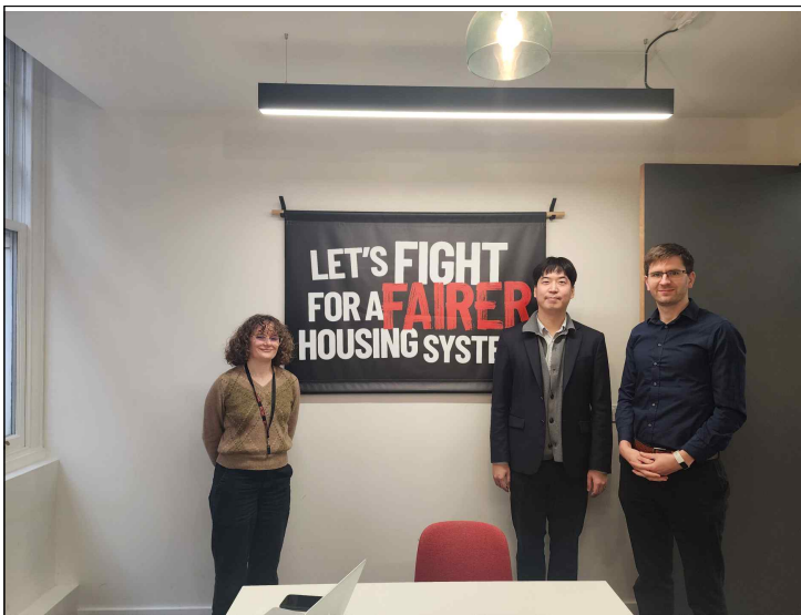
▲ Shelter 방문 사진(내부)