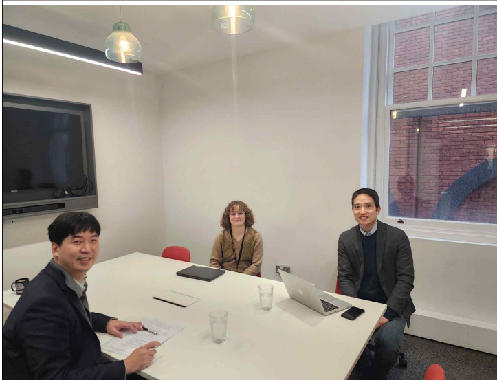
▲ Shelter 회의 사진