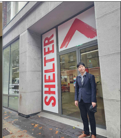
▲ Shelter 방문 사진(외부)