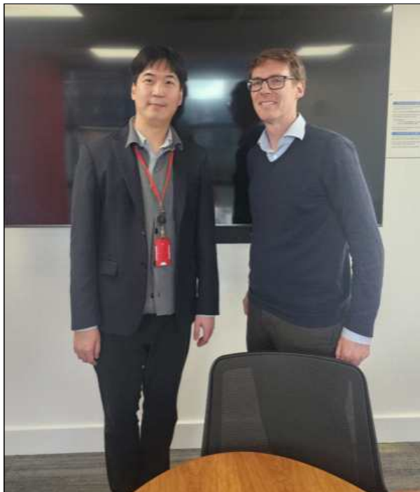
▲ NHF 방문 사진