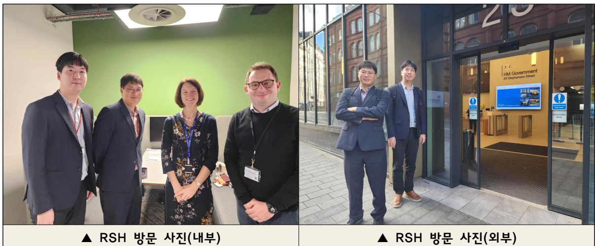
▲ RSH 방문 사진(내부)