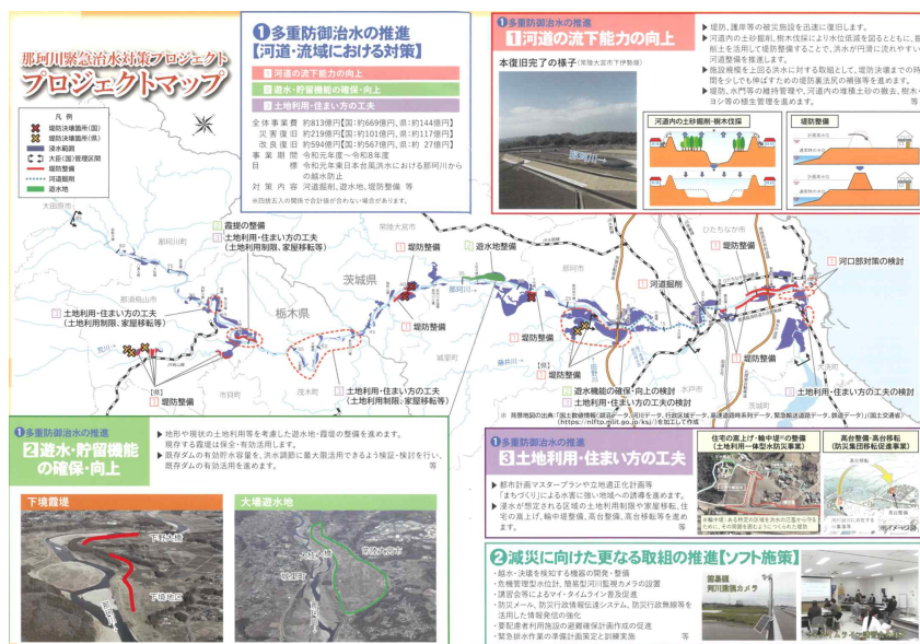
자료: 일본 내부자료