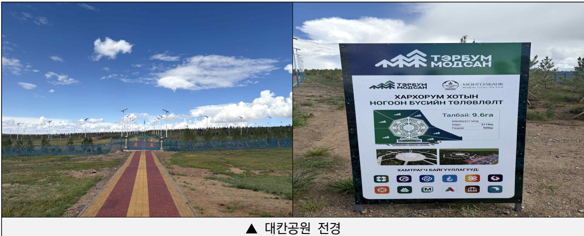
▲ 대칸공원 전경