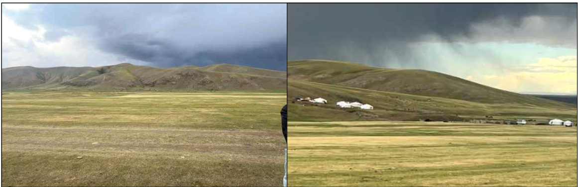
▲ 자갈란트 실린 도시유적