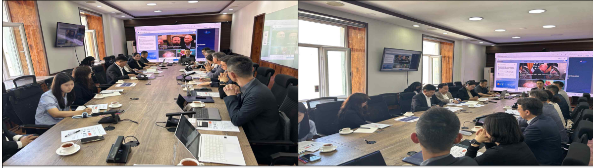
▲ MUDCH 업무협약(Kick-off)