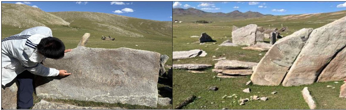
▲ 테멘 출분 골짜기 사슴들 무덤군