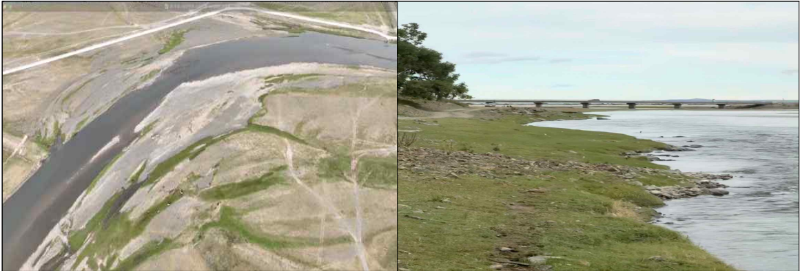
▲ 몽골제국 오르혼강 댐 건설지 및 관개수로