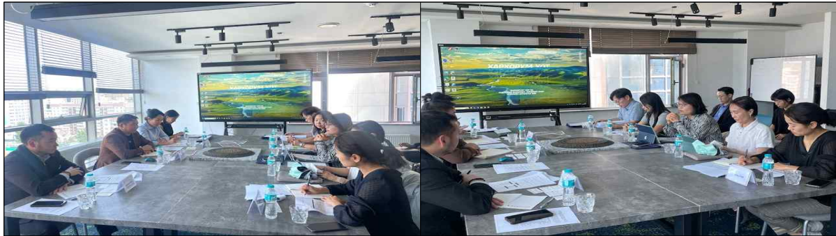
▲ 하르허롬 시장실 면담