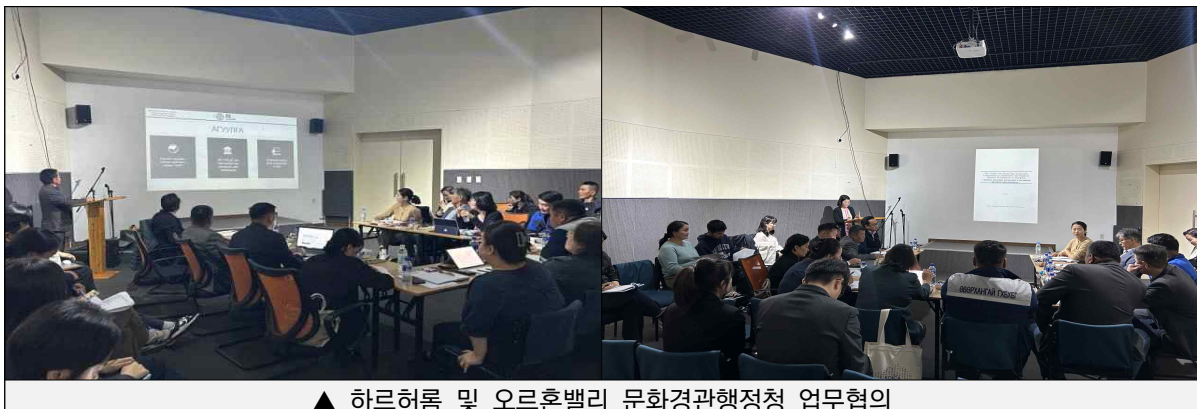
▲ 하르허롬 및 오르혼벨리 문화경관행정청 업무협의