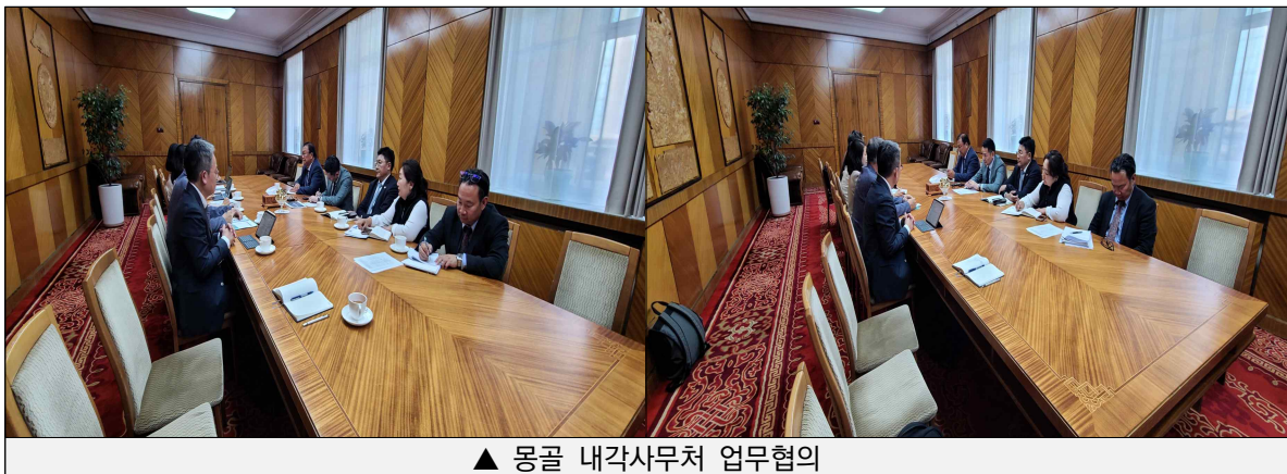
▲ 몽골 내각사무처 업무협의