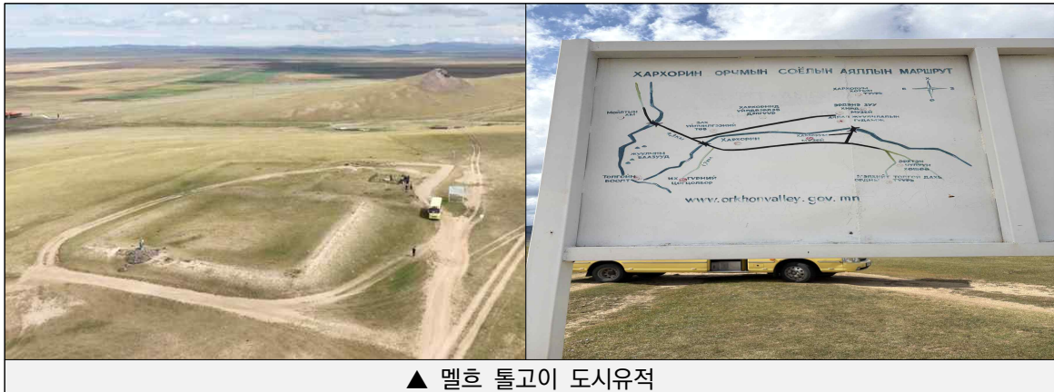
▲ 멜흐 톨고이 도시유적