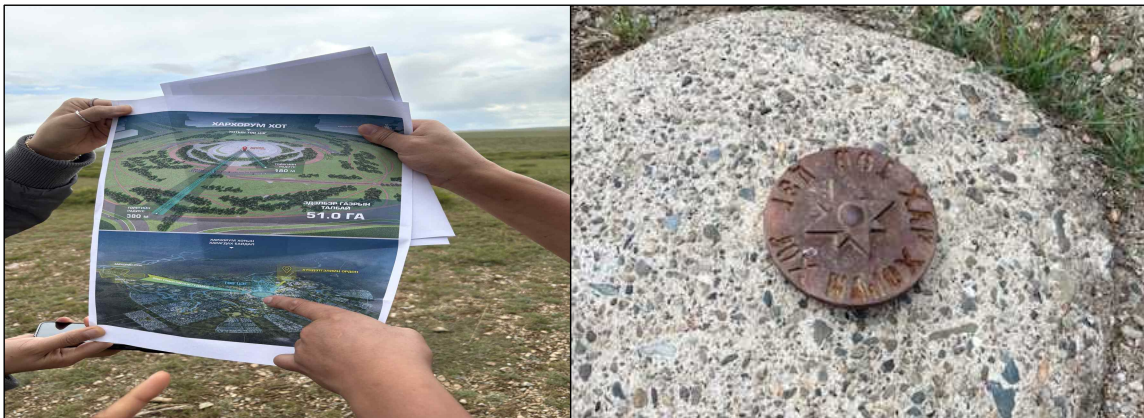
▲ 하르허름 개발사업구역 및 중심지 표지석