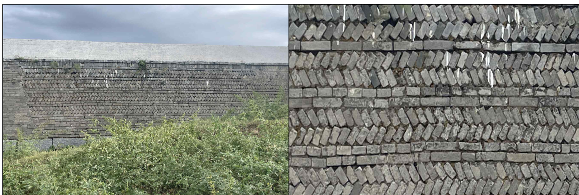
▲ 에르덴조 사원 벽체