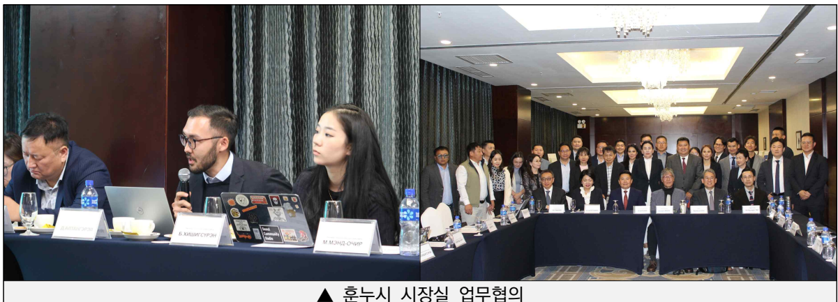
▲ 훈누시 시장실 업무협약