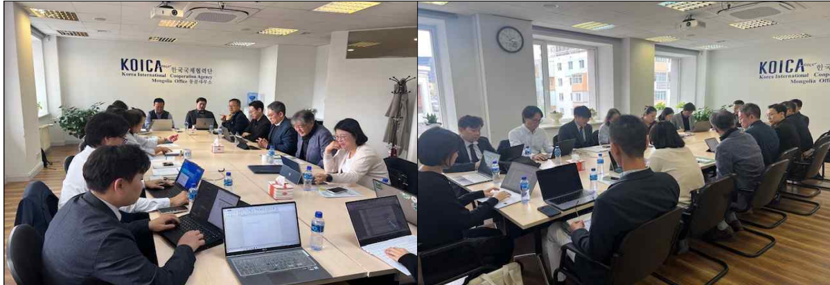
▲ KOICA 몽골사무소 Wrap-up 회의