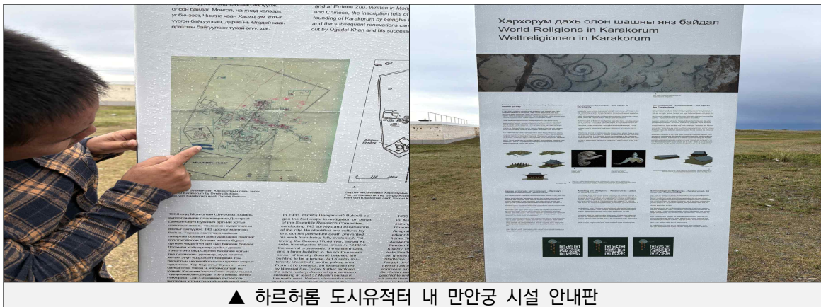
▲ 하르허름 도시유적터 내 만안궁 시설 안내판