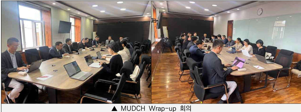
▲ MUDCH Wrap-up 회의