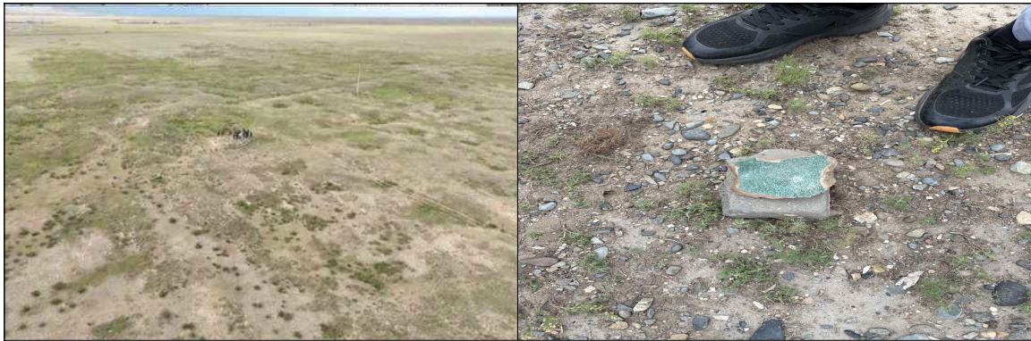
▲ 하르허롬 도시 유적터