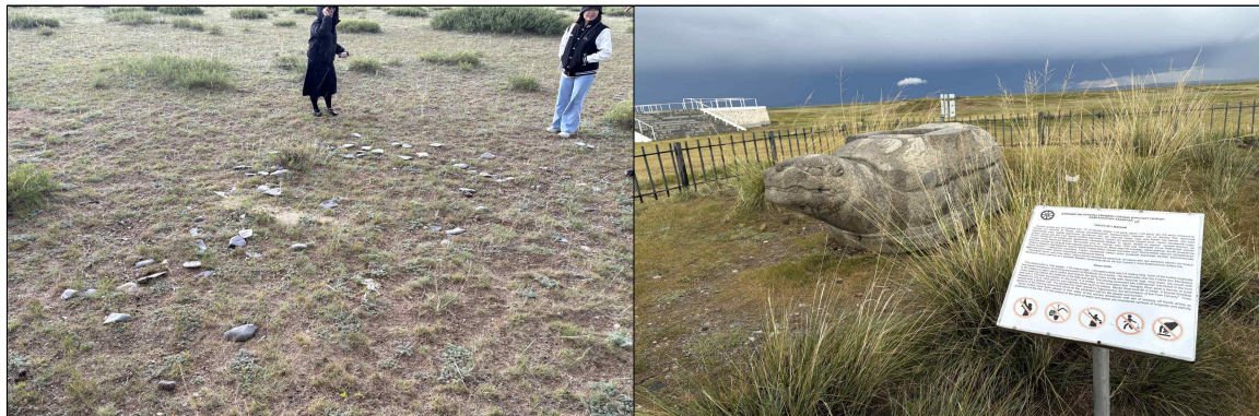
▲ 하르허롬 개발대상지 내 이슬람 고분군 보소 분지