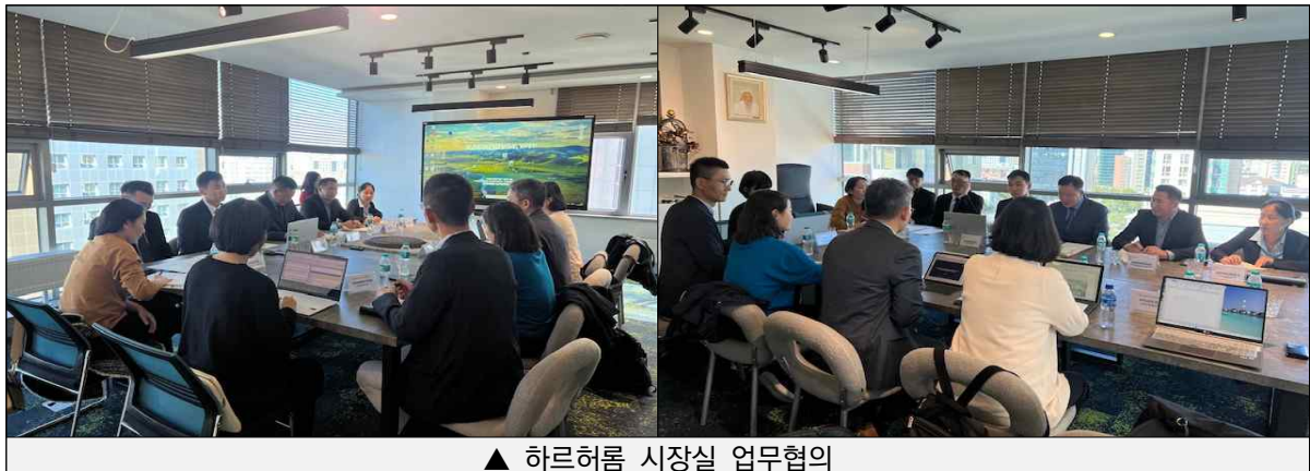
▲ 하르허롬 시장실 업무협의