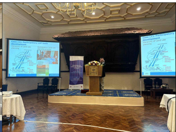
▲ 워크숍 회의장