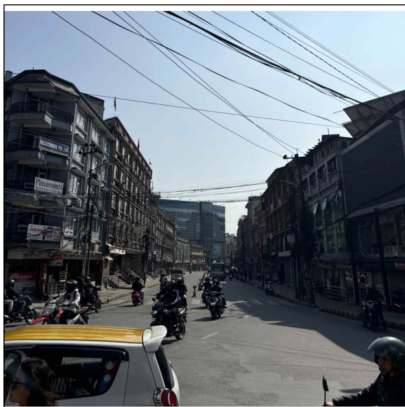
▲ 열악한 교통 인프라