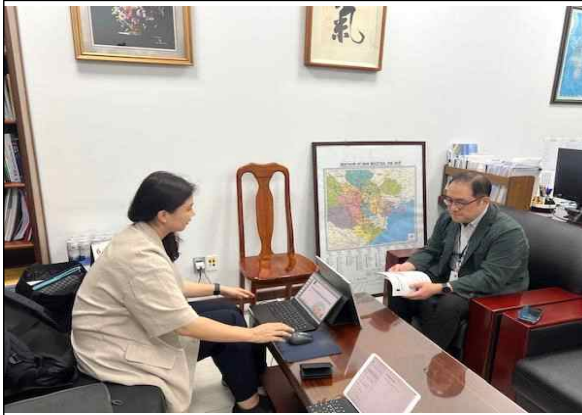
▲ 베트남 국토관 면담