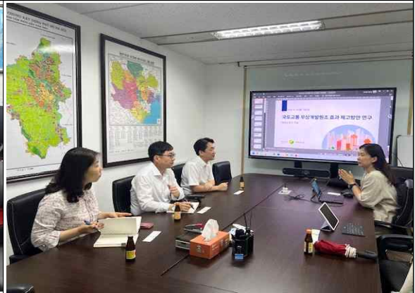
▲ LH 베트남지사 면담