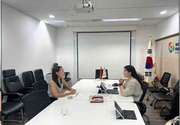
▲ KOICA 베트남 사무소 면담