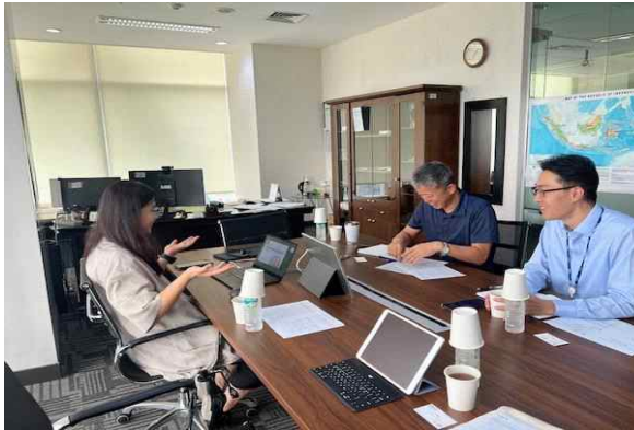
▲ KOICA 인도네시아 사무소 면담