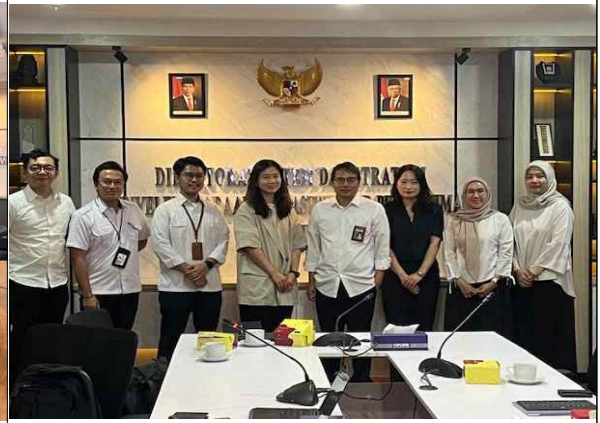
▲ 인도네시아 공공사업주택부 면담