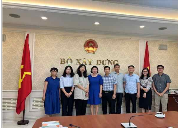
▲ 베트남 건설부 면담