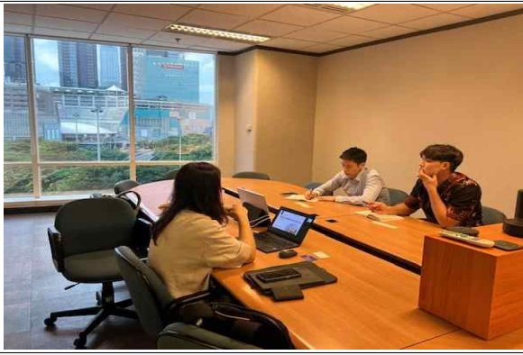
▲ KOTRA 인도네시아 무역관 면담