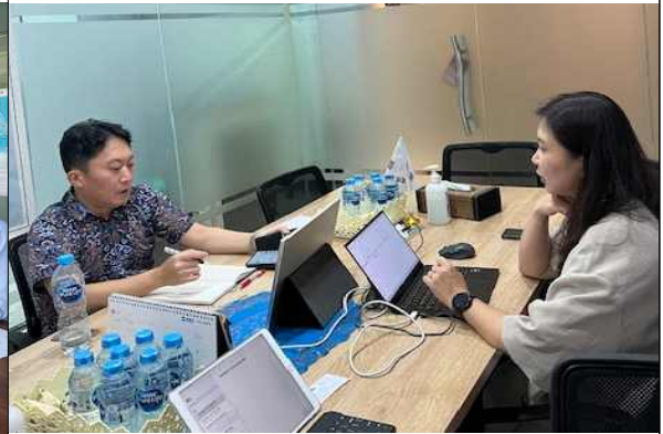
▲ KIND 인프라 협력센터 면담