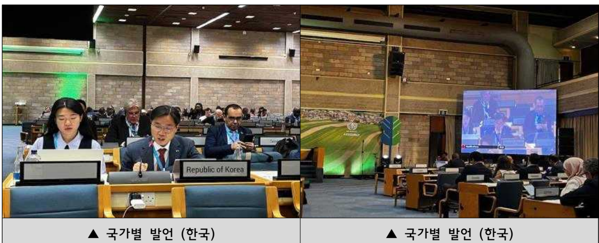
▲ 국가별 발언 (한국)