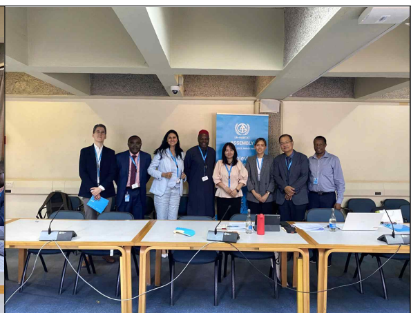
▲ 유엔 해비타트 본부와의 업무협의회 II