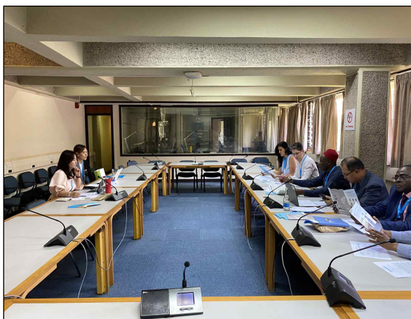
▲ 유엔 해비타트 본부와의 업무협의회 I