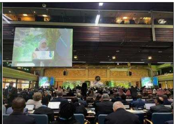
▲ 개막식 전경