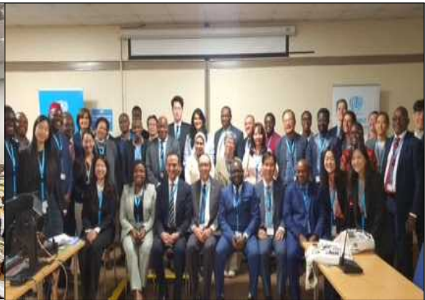
▲ NUPP 부대행사 전체 참여자