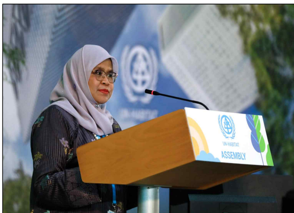
▲ Maimunah Mohd Sharif 사무총장