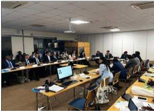
▲ NUPP 부대행사 전경