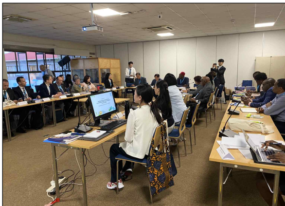
▲ 국토연구원 대표 발언