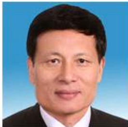
1954년 태생 中國 湖北