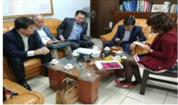
교통부 PPP국장 면담