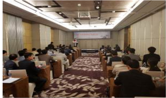
한-베 도로교통협력 세미나