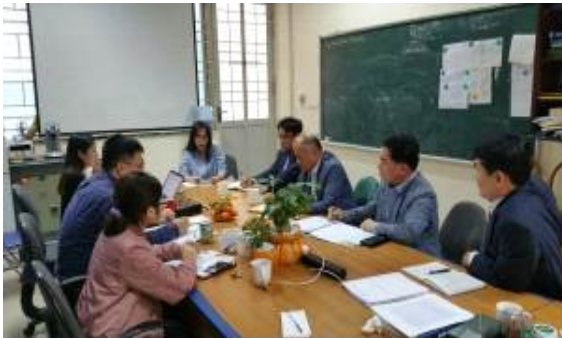
교통통신대 관계자 면담