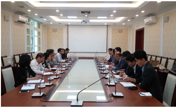
건설부 국제협력국장 면담