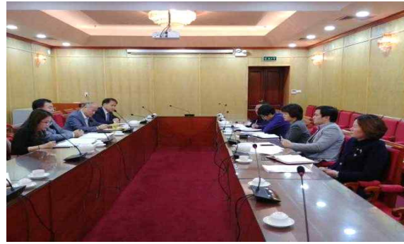
기획투자부 대외경제협력 부국장 면담