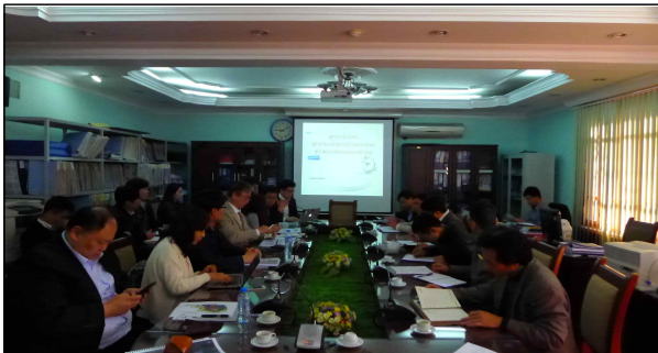
베트남 타이응웬성 인민위원회 회의 사진