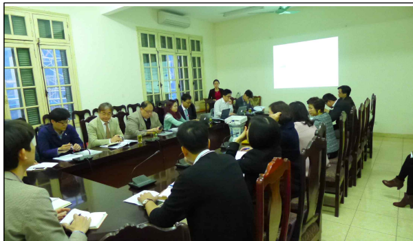
베트남 건설부(MOC) 회의 사진