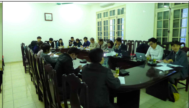
베트남 건설부(MOC) 회의 사진