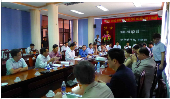
베트남 끼엔장성 락지아시 인민위원회 회의 사진