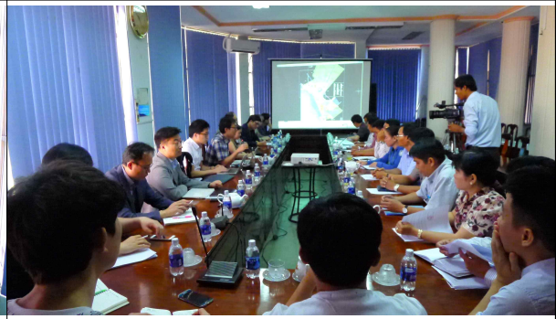
베트남 끼엔장성 락지아시 인민위원회 회의 사진