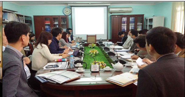
베트남 타이응웬성 인민위원회 회의 사진