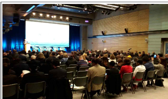
3.30(화) 개회식 및 기조연설