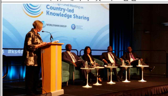
3.30(화) Plenary Session별 발표