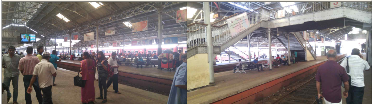
▲ 포트역 내부 1