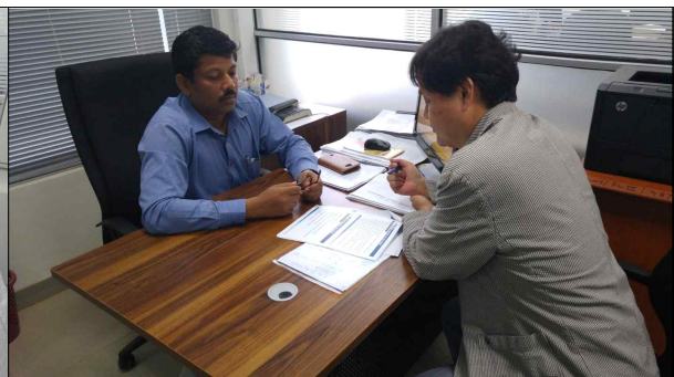
▲ 도로부 관계자 업무협의회 2