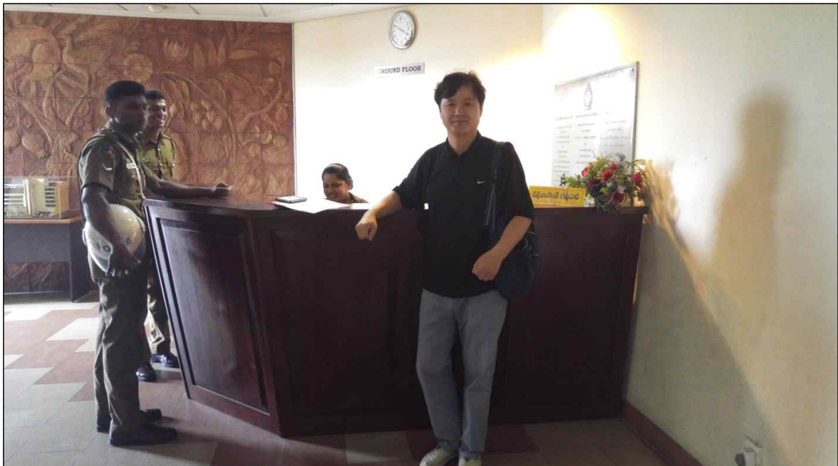
▲ 경찰청 업무협의