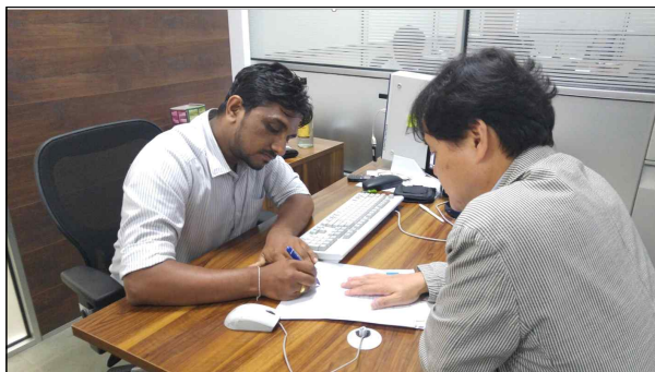
▲ 도로부 관계자 업무협의회 1