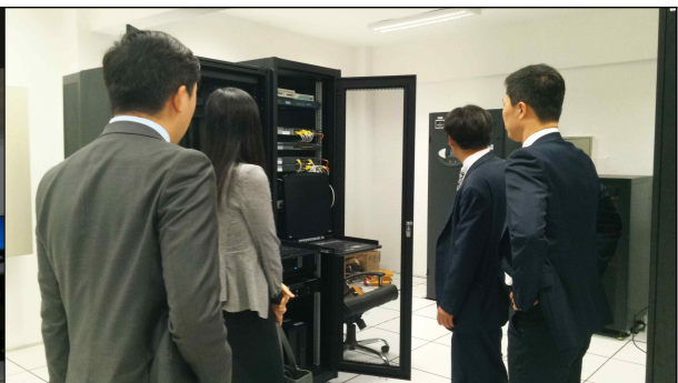
▲ ATMS센터 운영점검 2