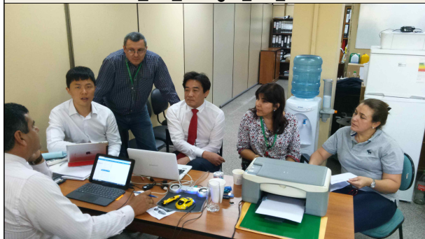
▲ 아순시온 시청 업무협의회 3