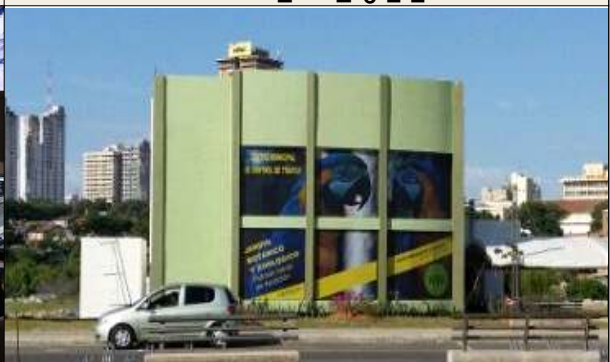
▲ ATMS센터 운영점검 4