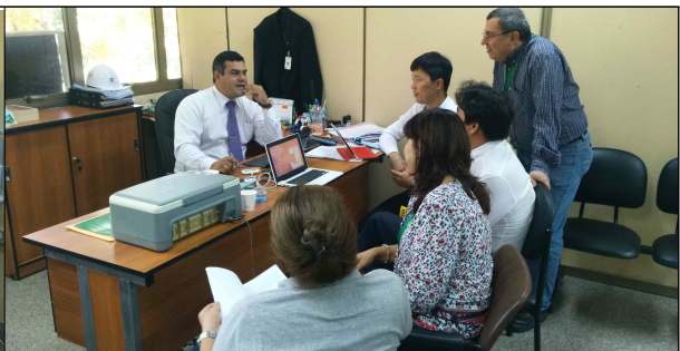
▲ 아순시온 시청 업무협의회 2