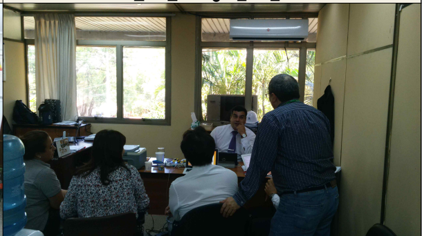
▲ 아순시온 시청 업무협의회 4