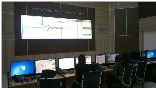
▲ ATMS센터 운영점검 1