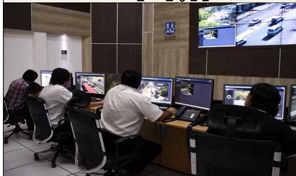
▲ ATMS센터 운영점검 3