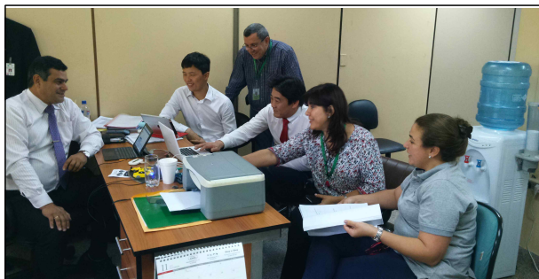
▲ 아순시온 시청 업무협의회 1