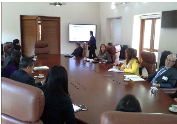
▲ 10월 5일 부통령실과의 회의 1