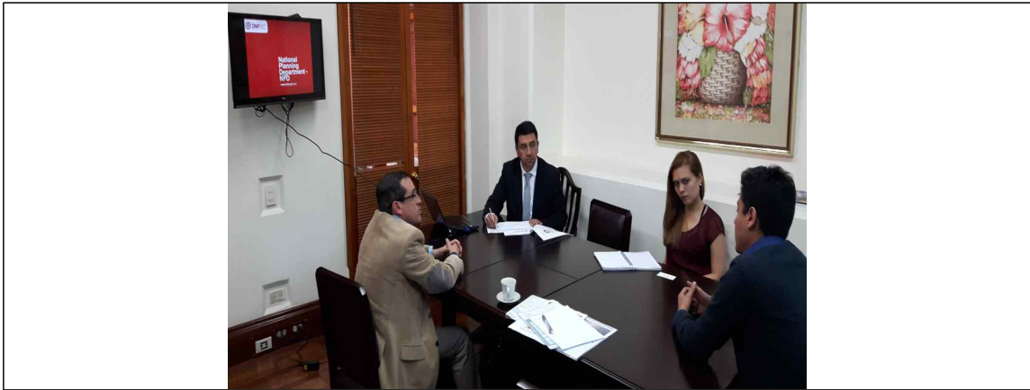
▲ 10월 7일 콜롬비아 국가계획처와의 회의