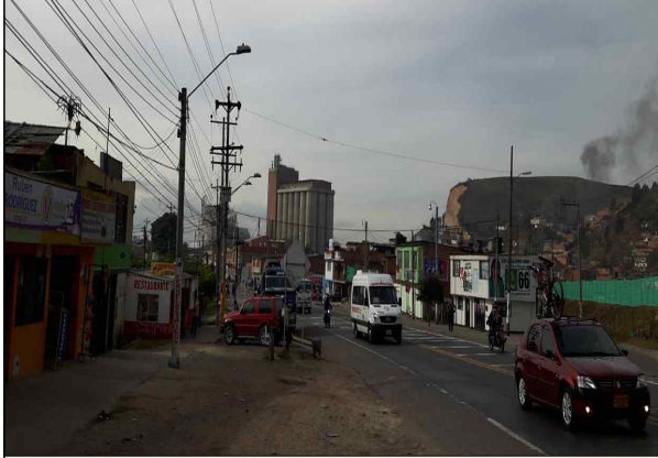
▲ 10월 7일 Facatativa 답사 1