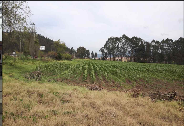
▲ 10월 7일 Facatativa 답사 4