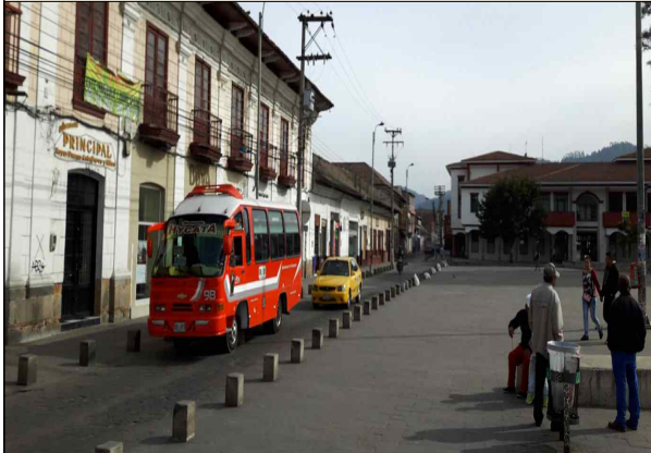
▲ 10월 7일 Facatativa 답사 3