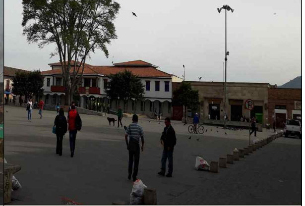
▲ 10월 7일 Facatativa 답사 2