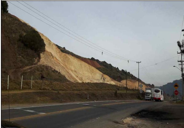
▲ 10월 7일 Facatativa 답사 5