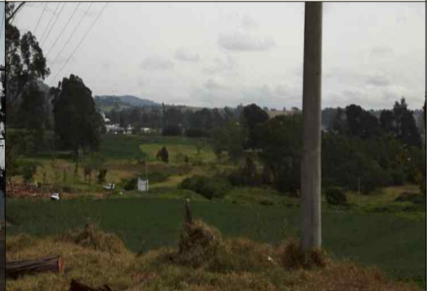
▲ 10월 7일 Facatativa 답사 6