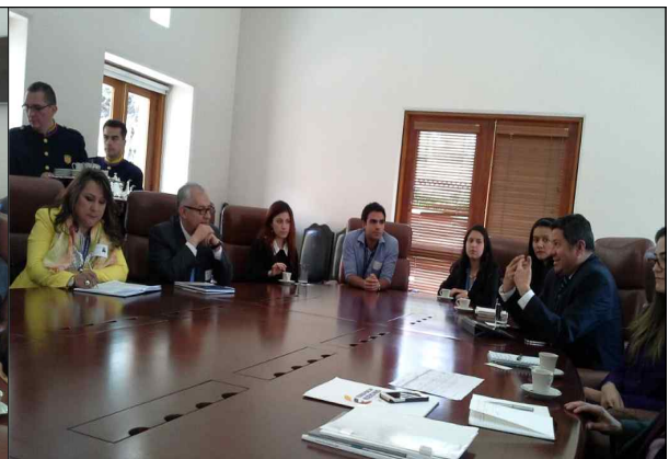
▲ 10월 5일 부통령실과의 회의 2