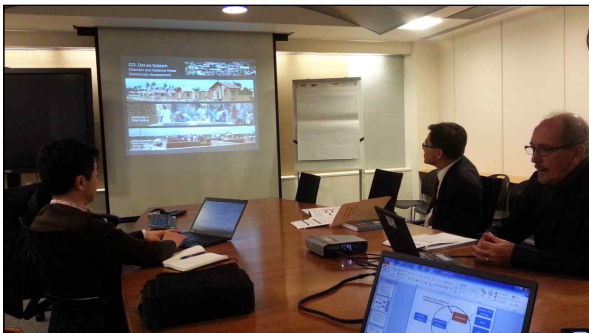
▲ Prep Meeting 장면