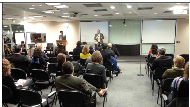
▲ Conference Day1 주요 발표