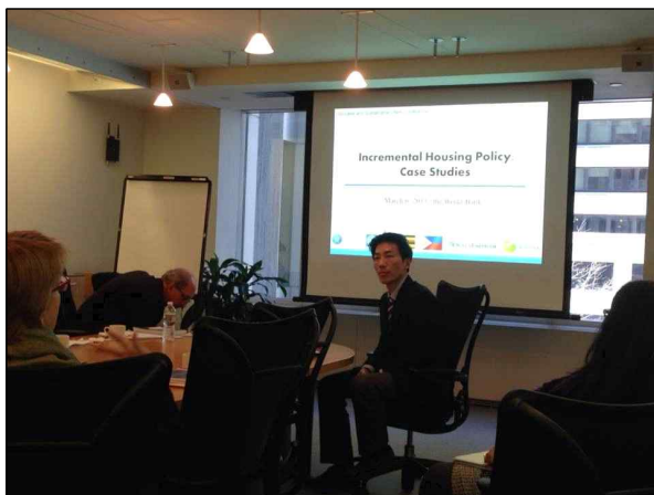
▲ Conference Day2 발표 장면