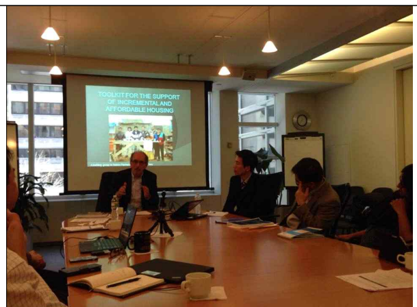
▲ Conference Day2 발표 장면