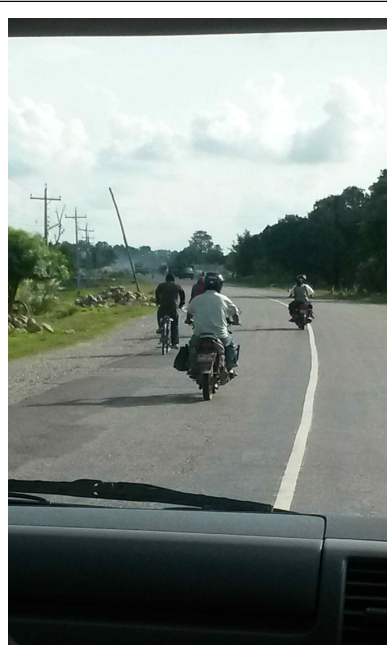
<사진2> 파라시 지역의 도로사정