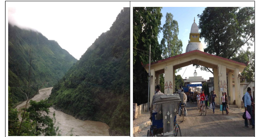
<사진3> 바랏푸르 지역의 자연환경