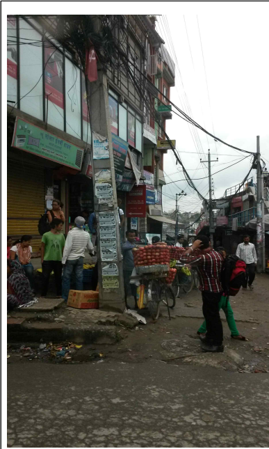
<사진1> 카트만두에서 무글링 사이의 도시 풍경