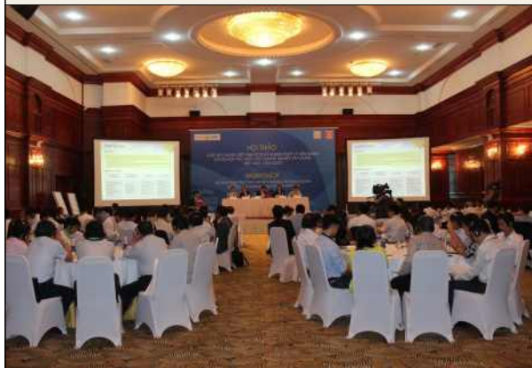
▲ 워크숍 전경