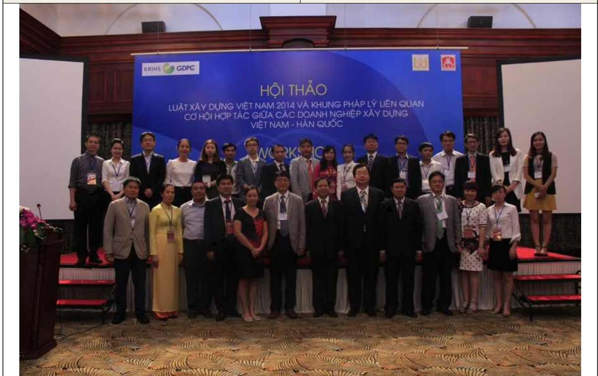
▲ 워크숍 기념촬영