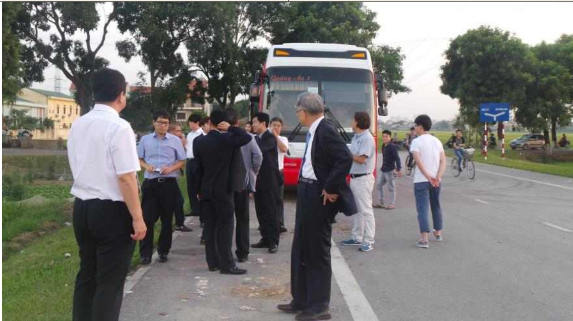
▲ 기재부 KSP 홍강 사업예정지역 답사