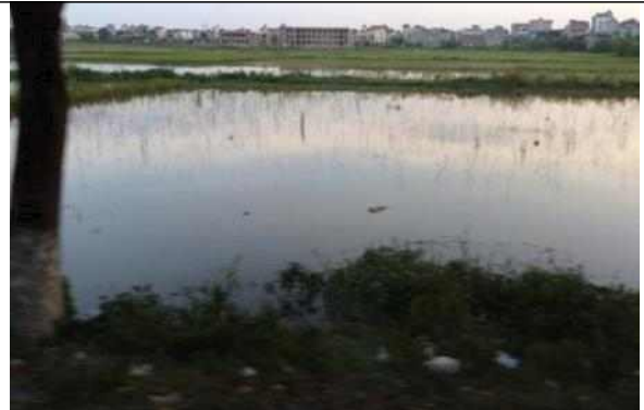
▲ 기재부 KSP 홍강 사업예정지역