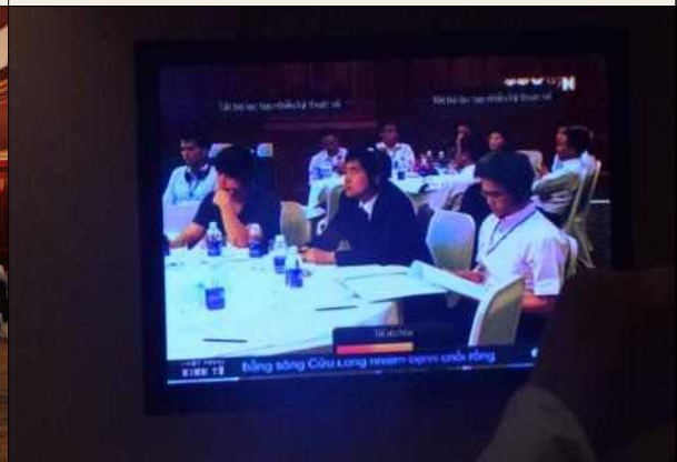
▲ 베트남 공영방송 방영