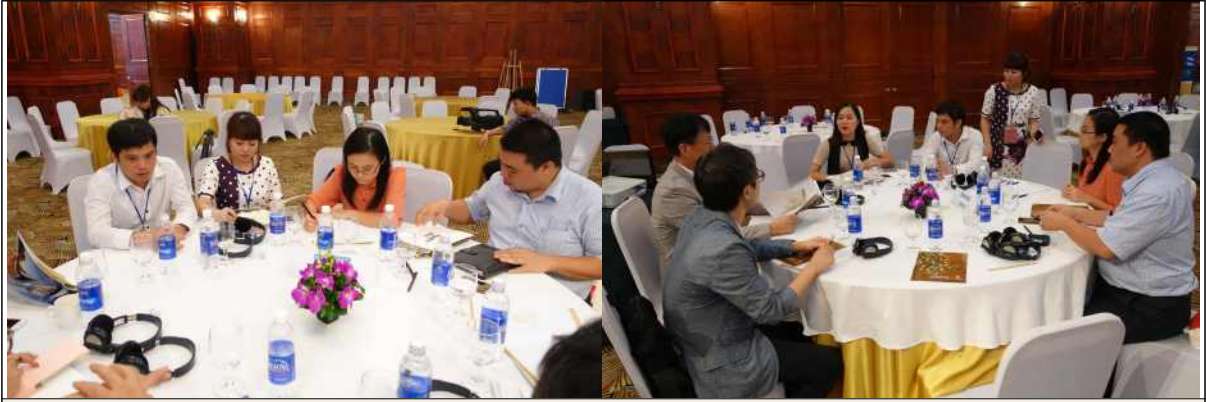
▲ LH공사-에코파크, SUDICO 면담