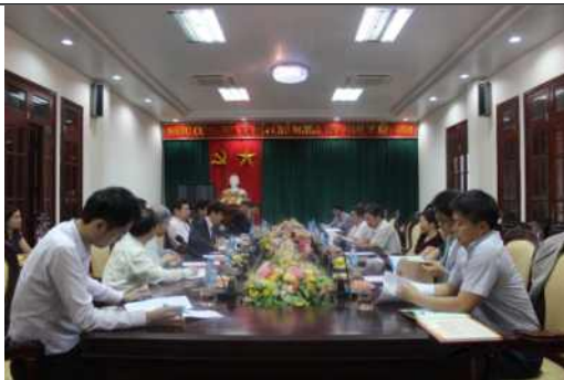
▲ 닌빈시 인민의회 회의 전경