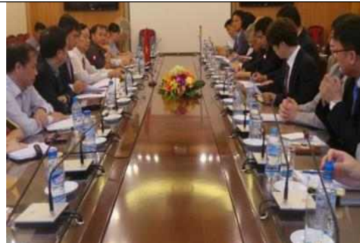
▲ 베트남 건설부 차관 접견 회의 전경