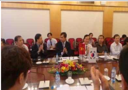
▲ 베트남 건설부 차관 접견 회의 종료