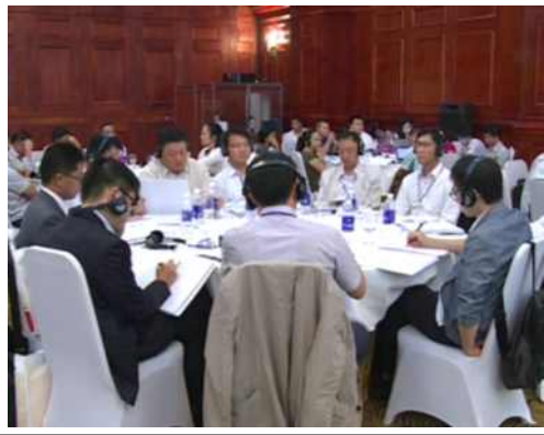
▲ 공영방송 뉴스 방영 워크숍 전경