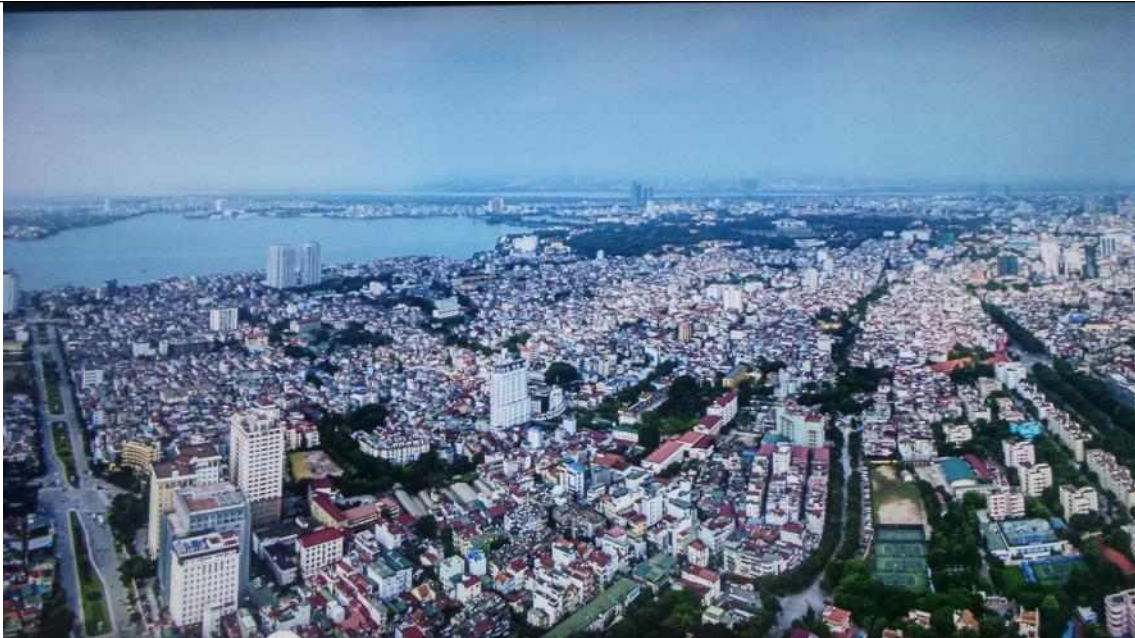
▲ 하노이 롯데센터 전망대