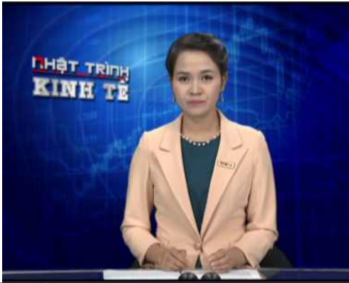
▲ 공영방송 뉴스 방영