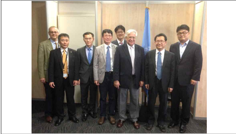
<UN 정주기구 사무총장 고위급 회담>