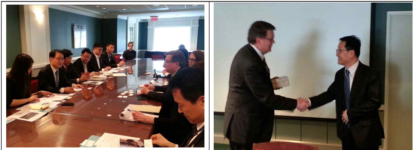
<국토연구원과 미국 우드로윌슨 센터간 공동연구를 위한 업무협약회>