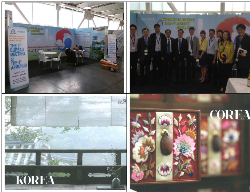
<제5차 APMCHUD 회의 홍보부스 및 한국소개 책자>