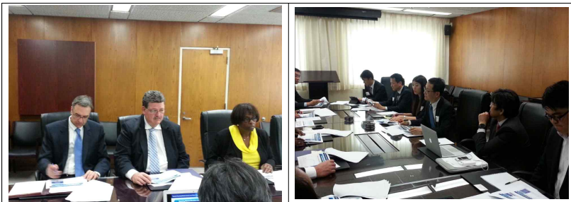
<국토교통부와 미국 주택도시개발부간 MOU 추진관련 회의>