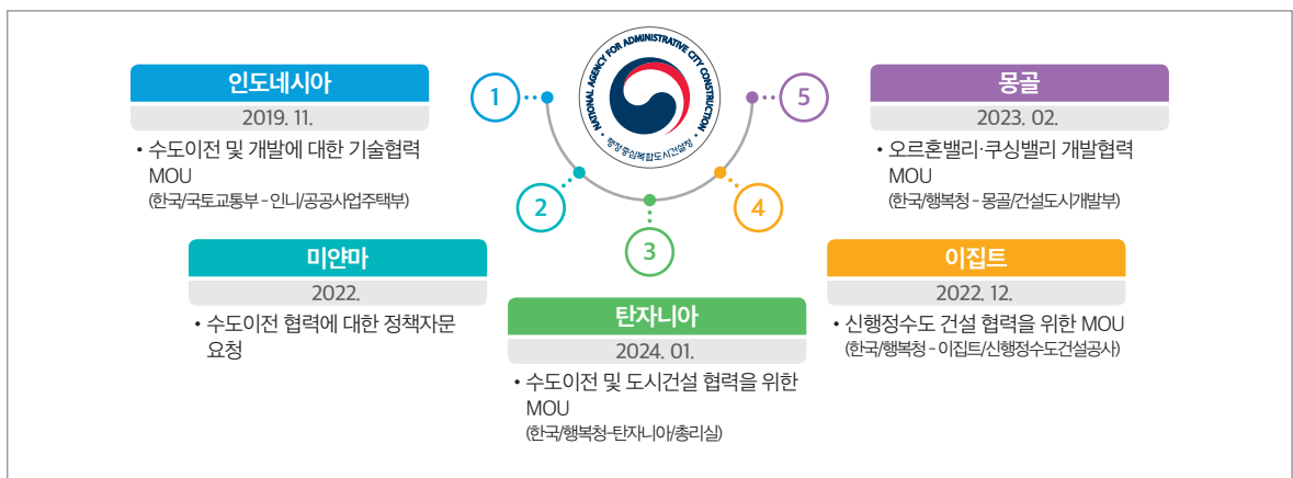
그림 1 수도이전 경험에 대한 지식교류 요청 및 약정 체결 현황